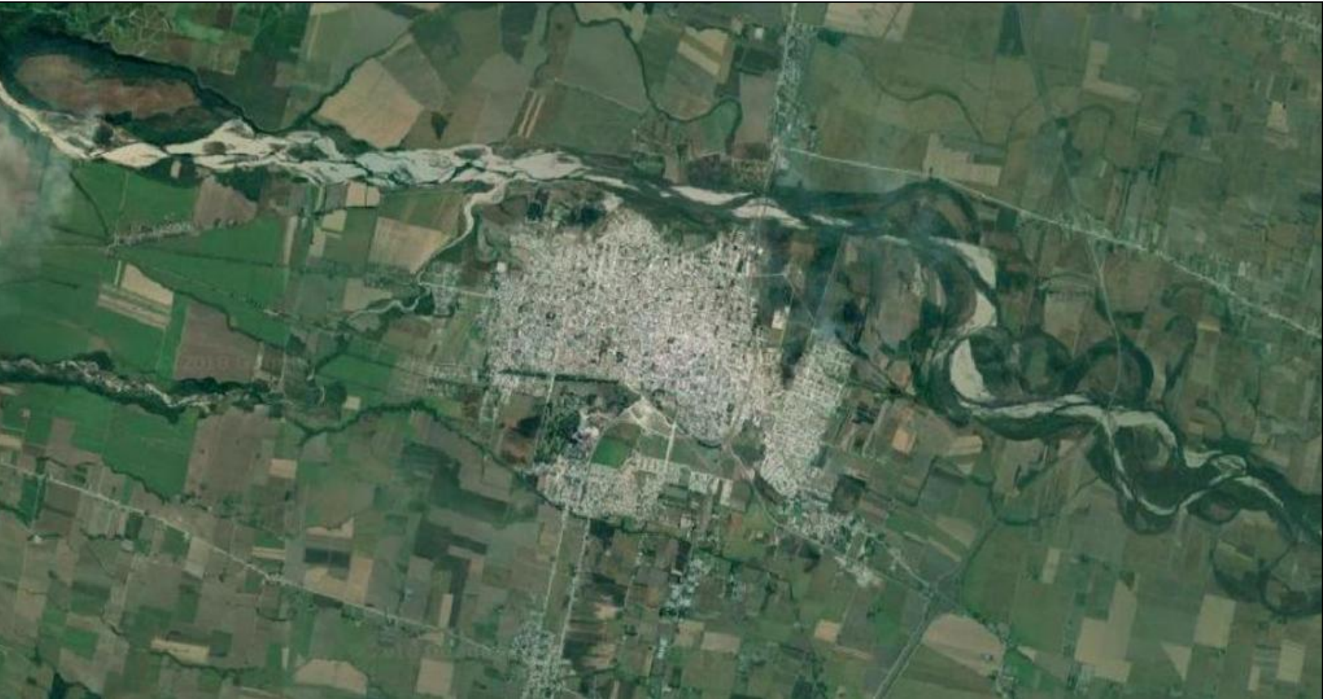
Vista satelital Concepción